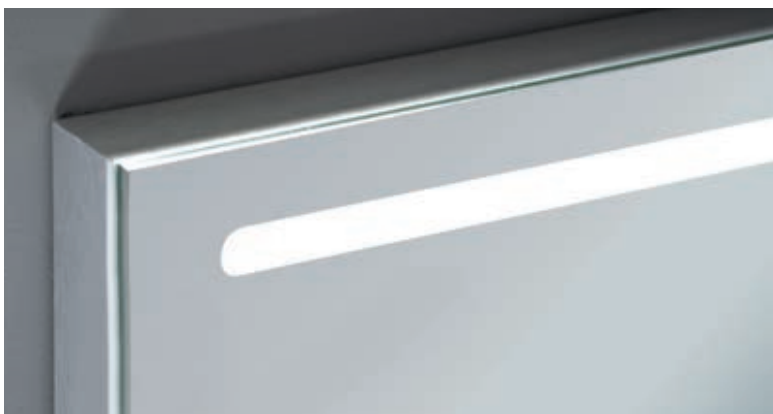
FRONTAL DEL ESPEJO