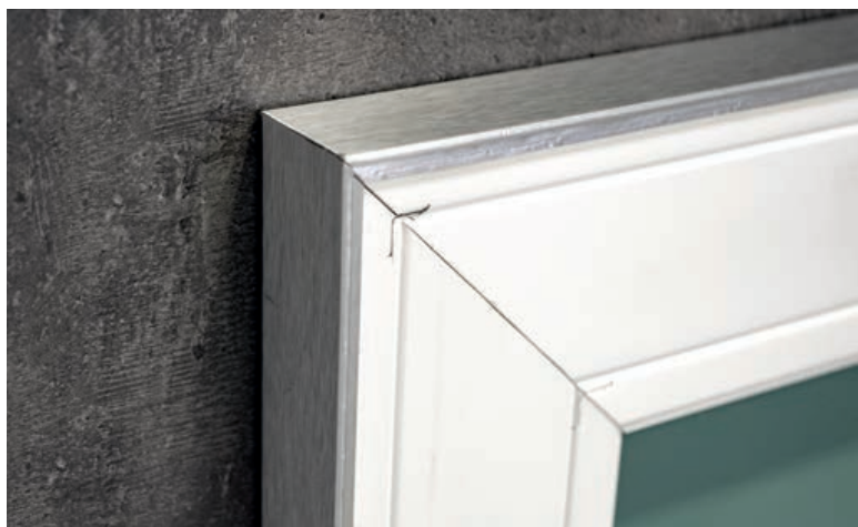
TRASERA DEL ESPEJO