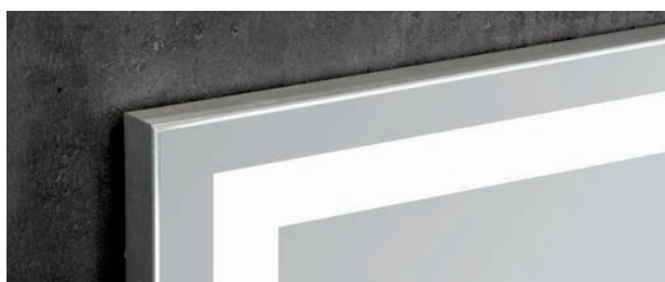
FRONTAL DEL ESPEJO