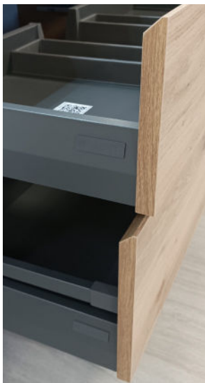
Imagen de detalle