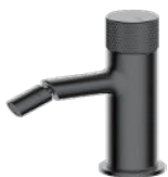
Gun metal 3553820755