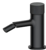
Negro mate 3553800755