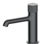
Gun metal 3553820752