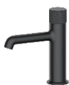
Negro mate 3553800752