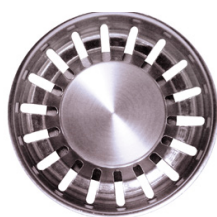
Válvula pullly 5900590001