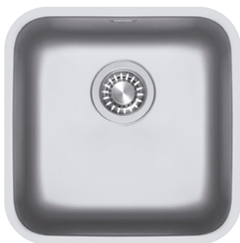
Inox Pulido 5900501001