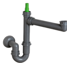
Sifón salva espacios simple 5900590005