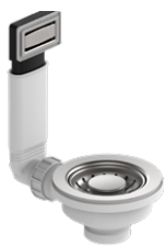
Válvula pullly con rebosadero 5900590000