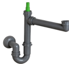
Sifón salva espacios simple 5900590005