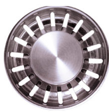
Válvula pull 5900590001