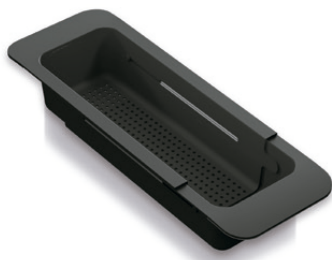
Cesta negra telescópica 40-58/135