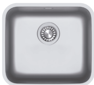
Inox Pulido 5900501002