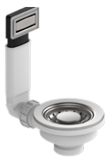
Válvula pull y con rebosadero 5900590000